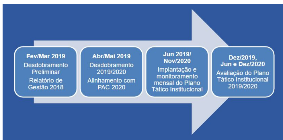
Figura 2 - Etapas do processo de elaboração e monitoramento do PTI TRT-RN 19-20

Em continuidade à formalização da sistemática de planejamento, monitoramento e avaliação das iniciativas táticas no TRT-RN, foi iniciado o projeto institucional “Desdobramento e Alinhamento da Estratégia”, que contou com o apoio da Presidência, assim como com a disponibilidade de magistrados e servidores do Tribunal, responsáveis