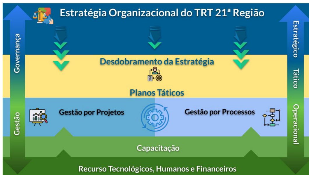
Figura 1 - Níveis do Planejamento

O planejamento tático visa contribuir para a execução da estratégia, ao especificar as iniciativas a serem realizadas por cada unidade da instituição e consolidá-las nos 17 planos que integram o PTI TRT-RN 19-20. Com base nos PTTs, os gestores poderão detalhar e priorizar as medidas operacionais a implementar na rotina organizacional, assim como alocar os recursos humanos, tecnológicos e financeiros necessários para fazer frente aos desafios a serem enfrentados. Deste modo, o alinhamento da estratégia com as operações ocorrerá por meio dos Planos Táticos Temáticos, tendendo a refletir positivamente na produtividade das equipes do Tribunal e no cumprimento das respectivas atribuições. Este documento apresenta a metodologia e os resultados do processo de planejamento tático elaborado pelo TRT-RN para os anos de 2019 e 2020. Cada capítulo se refere a um componente da cadeia de valor do tribunal, podendo contemplar um ou mais planos temáticos. Após os planos táticos, está apresentado um modelo simplificado para gestão do Plano Tático Institucional e as considerações finais.