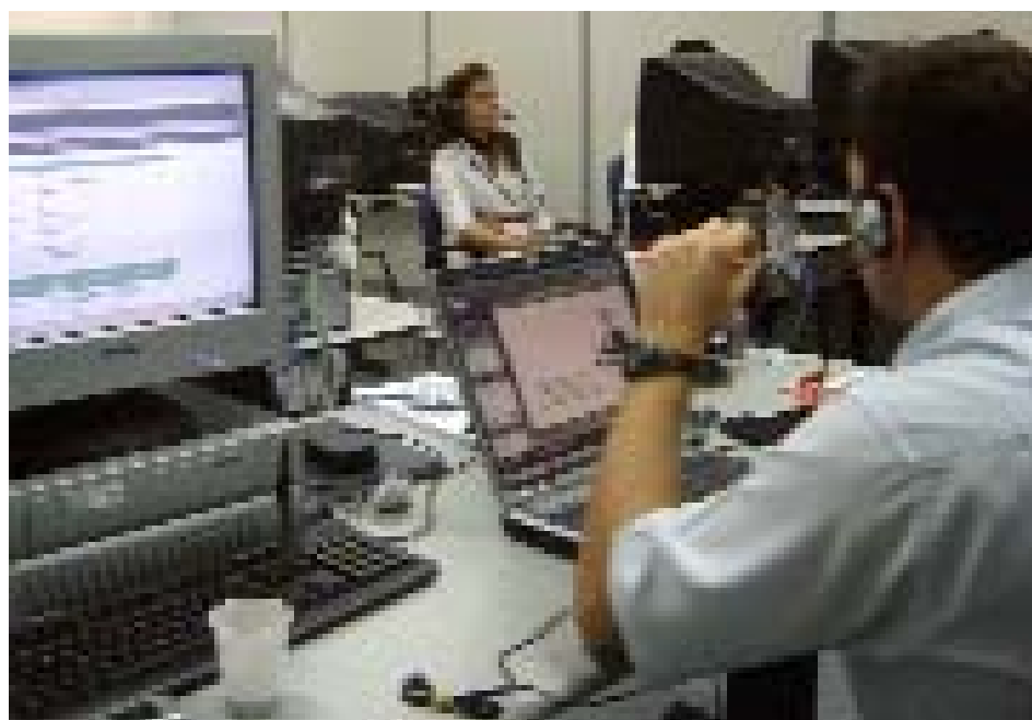
Cursos na área de informática, qualificam servidores para melhor desempenho

• O TRT potiguar irá se adequar ao sistema de Gestão e Política de Investimento, utilizando como base o modelo implantado no TRT 3ª Região. A idéia é haver não só uma mudança no organograma do tribunal em termos de