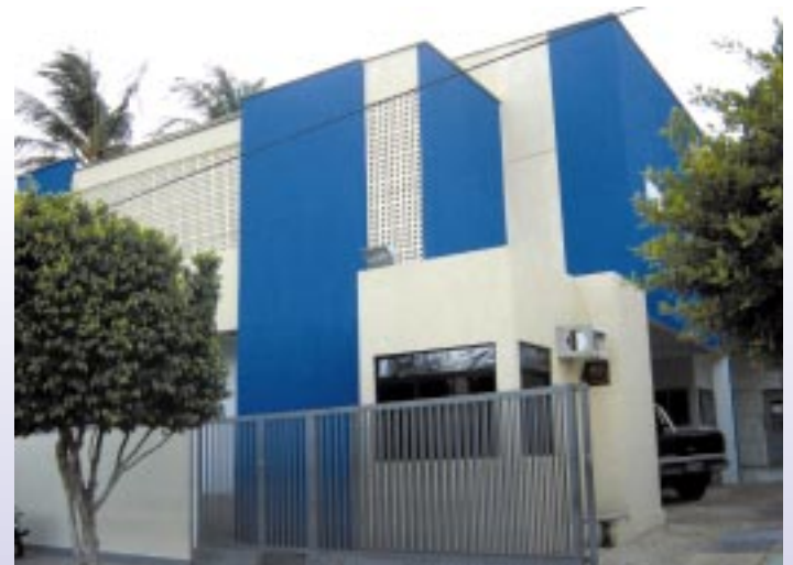
Atual prédio da 1ª e da 2ª Varas de Mossoró

As atividades da Justiça do Trabalhista em Mossoró foram ampliadas e ganharam novo reforço com a criação da 3ª Vara do Trabalho pela Lei nº 10.770, de 21 de novembro de 2003.