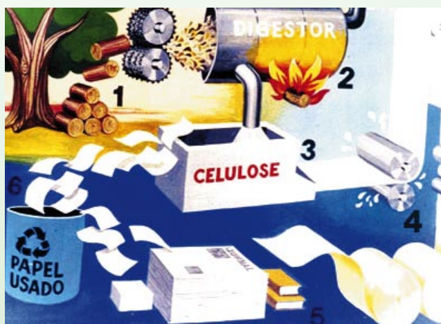
Reciclar papel ajuda na preservação de muitas árvores. Com a coleta seletiva, o TRT-RN preservou mais de mil árvores

Declaram os coordenadores que o Programa de Coleta Seletiva de Papel serviu como parâmetro para a implementação de projetos semelhantes em diversas instituições. Alguns Tribunais da Justiça do Trabalho e outros órgãos públicos são