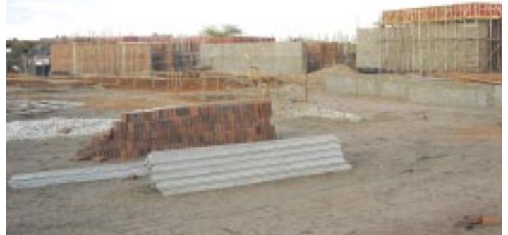
As obras do Fórum Trabalhista de Mossoró foram iniciadas em dezembro de 2005

Com todas essas atividades que constituem a