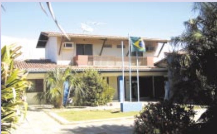
Prédio onde funciona atualmente a 3ª Vara de Mossoró